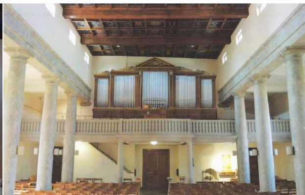
Orgue de demain